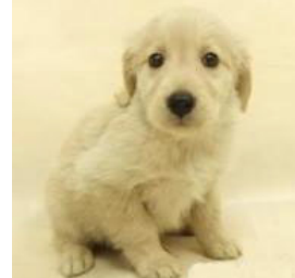
ゴールデン・レトリバー 長田 サラちゃん