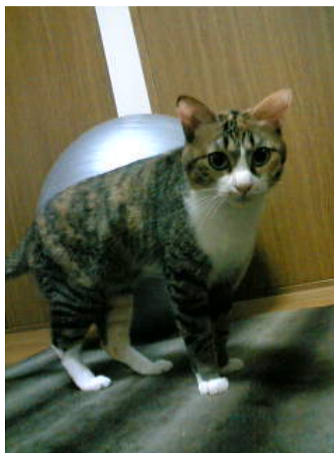
たび（足袋）：手足の先だけ白く足袋を履いている ような毛色なので

【調査方法】アニコム損保のペット保険「どうぶつ健保」契約者に対し、インターネット上でアンケートを実施 【実施期間】2009年10月15日～10月19日（有効回答数 1,092）