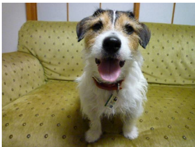
ジャスパー：好きな小説にでてくる犬の名前から。 おとなしく、お利口な犬のキャラクター だったので。